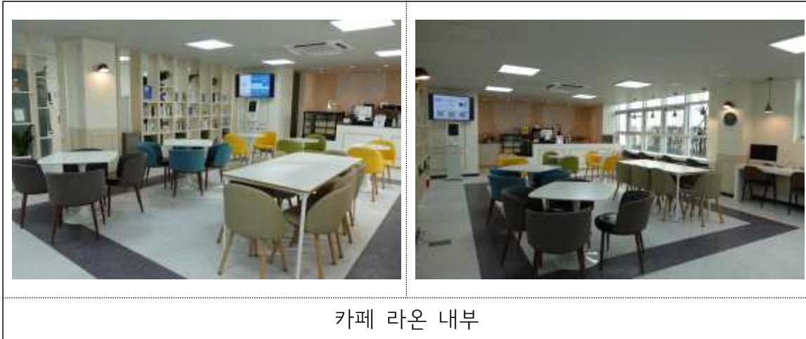
카페 라운 내부