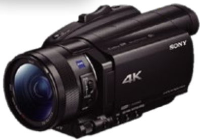
소니 FDR-AX700 4K UHD 1420만 화소