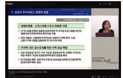
온라인 강의 화면