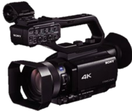
소니 HNR-NX80 4K UHD 1200만 화소