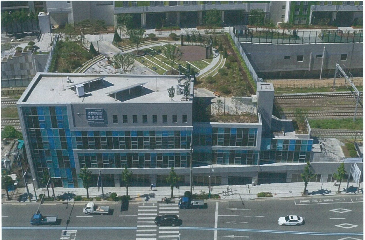
서대문구 사회적경제마을자치센터 전경