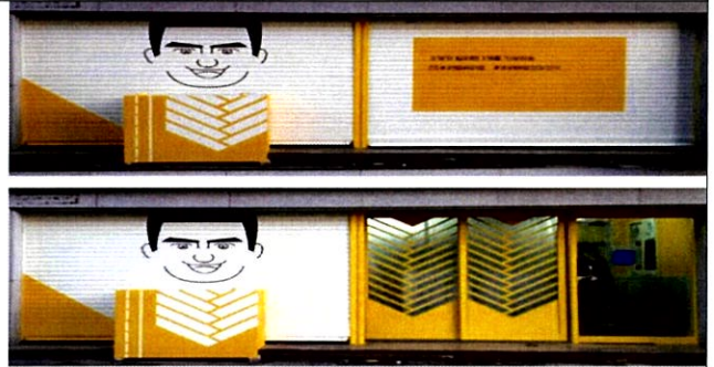
리얼씨리얼 x 해우 예술가(점주지출실비 320,000원/ 외벽페인팅 등 6개 프로젝트 실시)