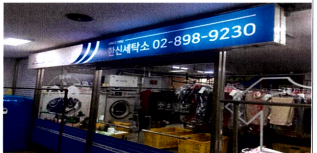
한신세탁소 x 김신혜 예술가(점주지출실비 543,000원/ 캐릭터디자인 등 6개 프로젝트 실시)