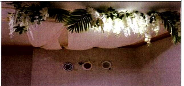
건강대중탕 x 신여록 예술가(점주지출실비 325,000원/ 내부디자인 개선 등 4개 프로젝트 실시)