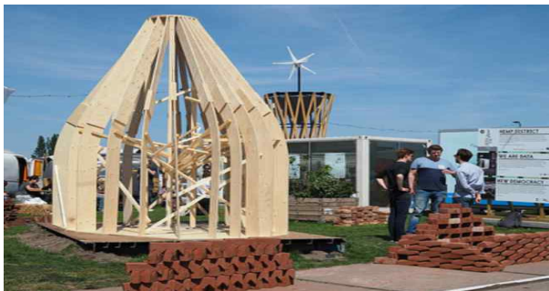
2016 팍시티 캠퍼스