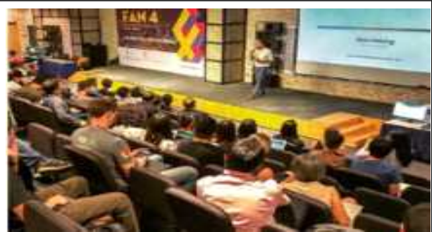
FAN 4 강연