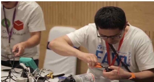
FAN 4 글로벌 해커톤