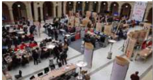
2017년 FAB 13 슈퍼페스티벌