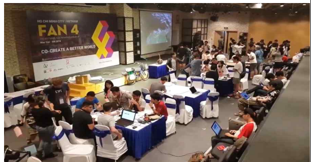
FAN 4 워크숍