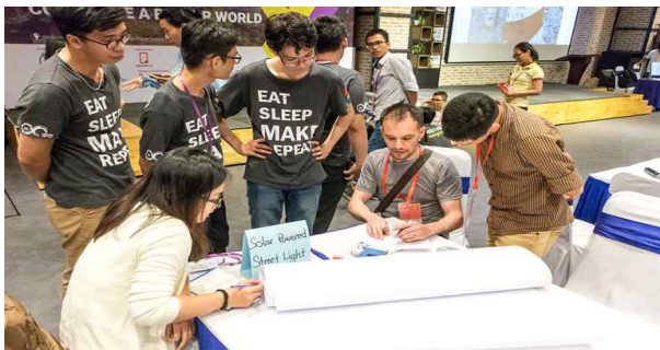
FAN 4 워크숍