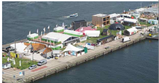
2016 팍시티 캠퍼스