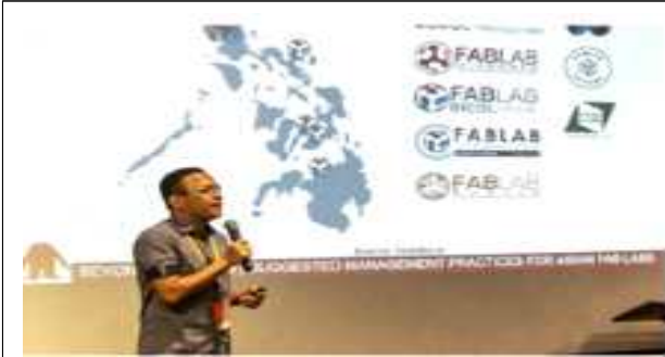
FAN 4 랩리뷰