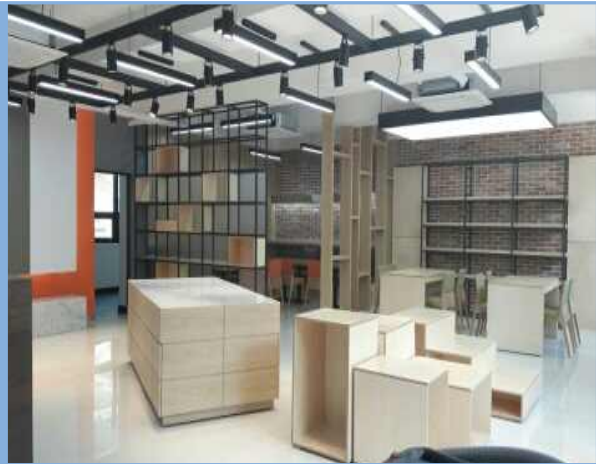
센터1층 커뮤니티 공간