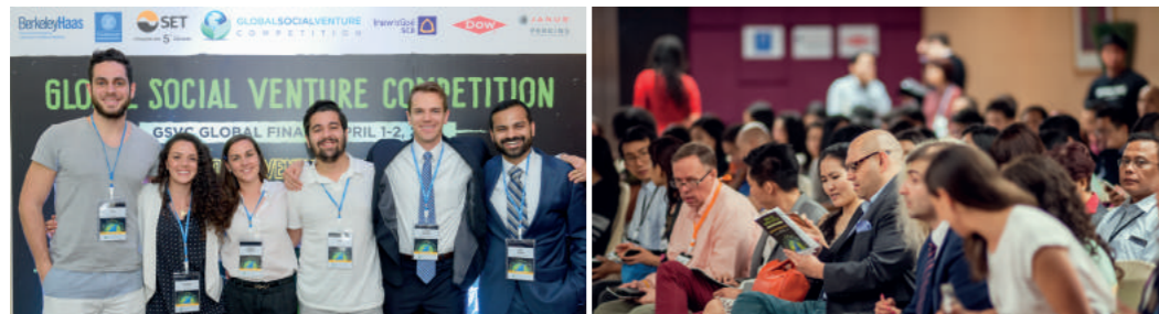
글로벌 소셜벤처 경진대회(2016)

GSVC 공식 규정 중 '대학 재학생 또는 4년 이내 졸업생, 대학원 재학생 또는 2년 이내 졸업생 최소 1명 포함'이라는 지원자격 규정이 있지만, SVCA 대회는 위 규정에 포함되지 않더라도 국내의 사회적기업 및 소셜벤처의 인지확산과 사회적 임팩트의 확장이라는 본 대회의 취지에 부합하는 일반 청년 창업팀의 참가도 독려하고있습니다.