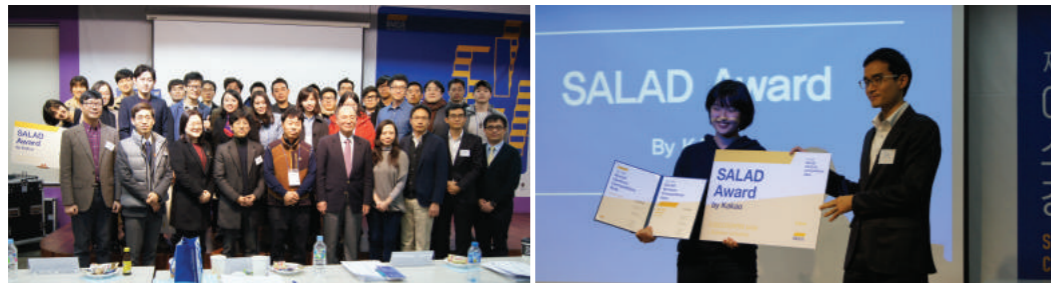
제 10회 아시아 소셜벤처 경진대회(2015)