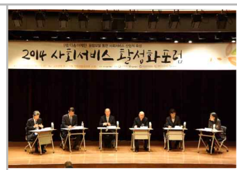
세션 1 - 토론회