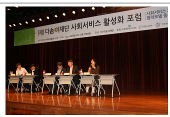
세션 2 - 토론회