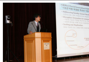
세션 1 - 주제발제