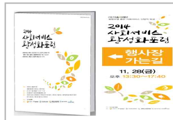
포럼 참석자 대상 자료집