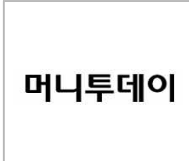
토론자 - 머니투데이 ■ (주)이로운넷 에디터