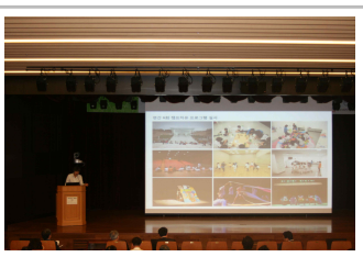
세션 2 - 사례발표