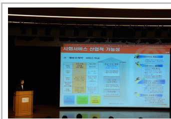
세션 2 - 사례발표