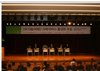
세션 1 - 토론회