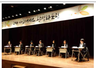
세션 2 - 토론회