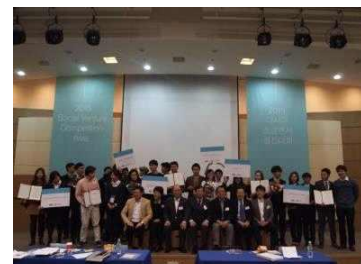
참가팀 단체 사진