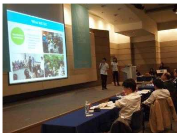
SVCA 팀 발표