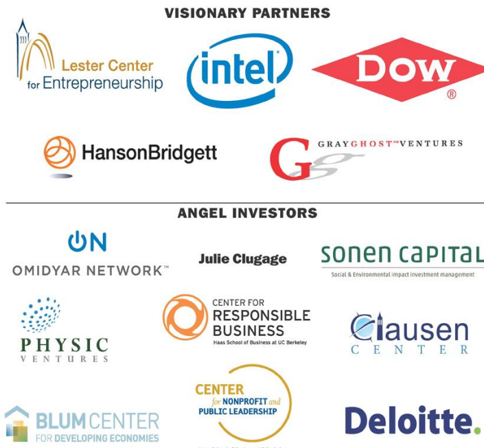
[GVC 주요 스폰서]