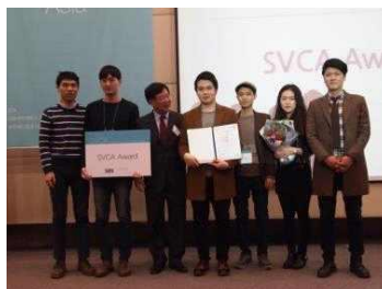
제 9회 SVCA 대상 수상팀(Lumir)