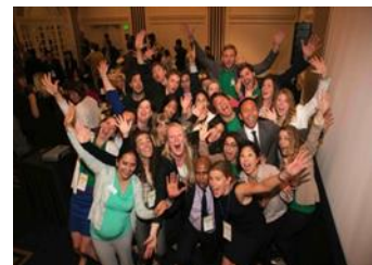
참가팀 단체 사진