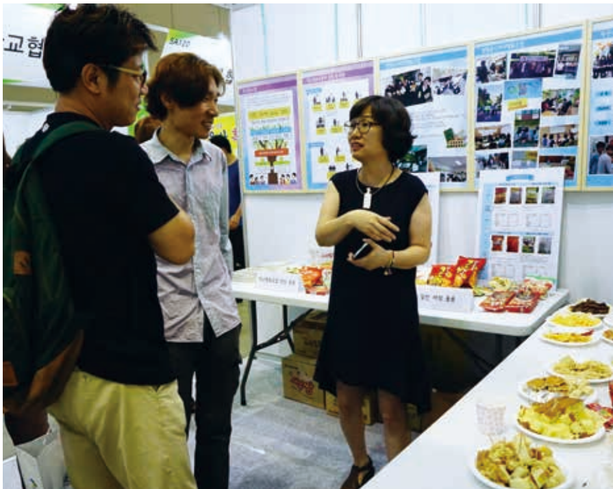
学校協同組合博覧会

ソウル市民の生活の質の向上のために、協力-共生-連帯といった戦略的なアプローチを通じて、ビジネスモデルの構築-拡大-再生産を促し、市民の生活体感度と社会的価値を最大化します。