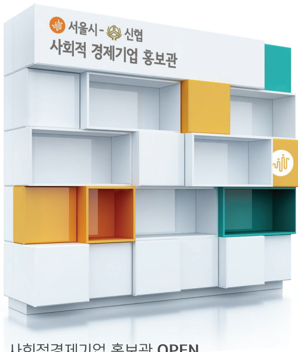
사회적경제기업 홍보관 OPEN