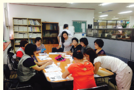
주민주도 지역현황 및 자원조사