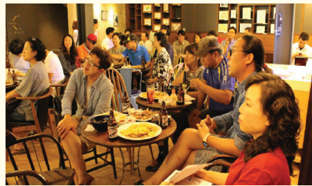
주민주도 다양한 문화프로그램 운영