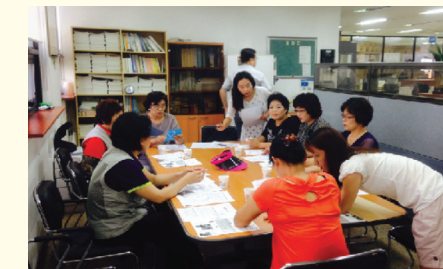
주민주도 지역현황 및 자원조사