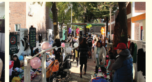
공동체 활성화 프로그램 운영