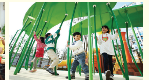
어린이 놀이터 및 공원