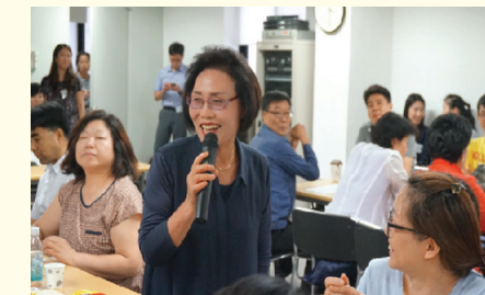
주민모임을 통한 실행방안 제시