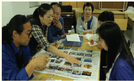
지역문제 해결을 위한 주민활동