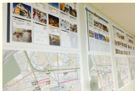
지역의제발굴 및 실행방안 마련