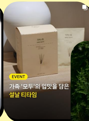
EVENT 가족 '모두'의 입맛을 담은 설날 티타임