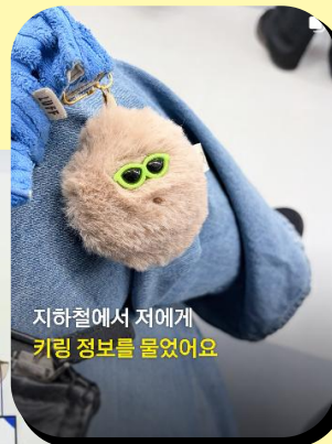
지하철에서 저에게 키링 정보를 물었어요