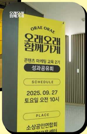
#마케팅 교육 지원