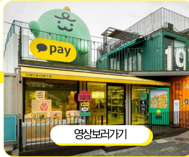
2025 팝업스토어 스케치