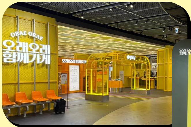
#대규모 팝업 개최

- 팝업 지원 효과 추산 금액 : 한국신용데이터 소상공인 동향리포트(2023~2025) 소상공인 사업장당 분기별 평균 지출금액 기준 팝업스토어 운영 기간 참여 소상공인 브랜드 당 지출금액