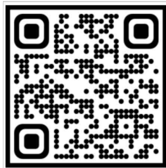
프렙 아카데미 인스타그램