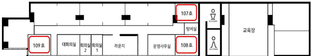
평 면 도