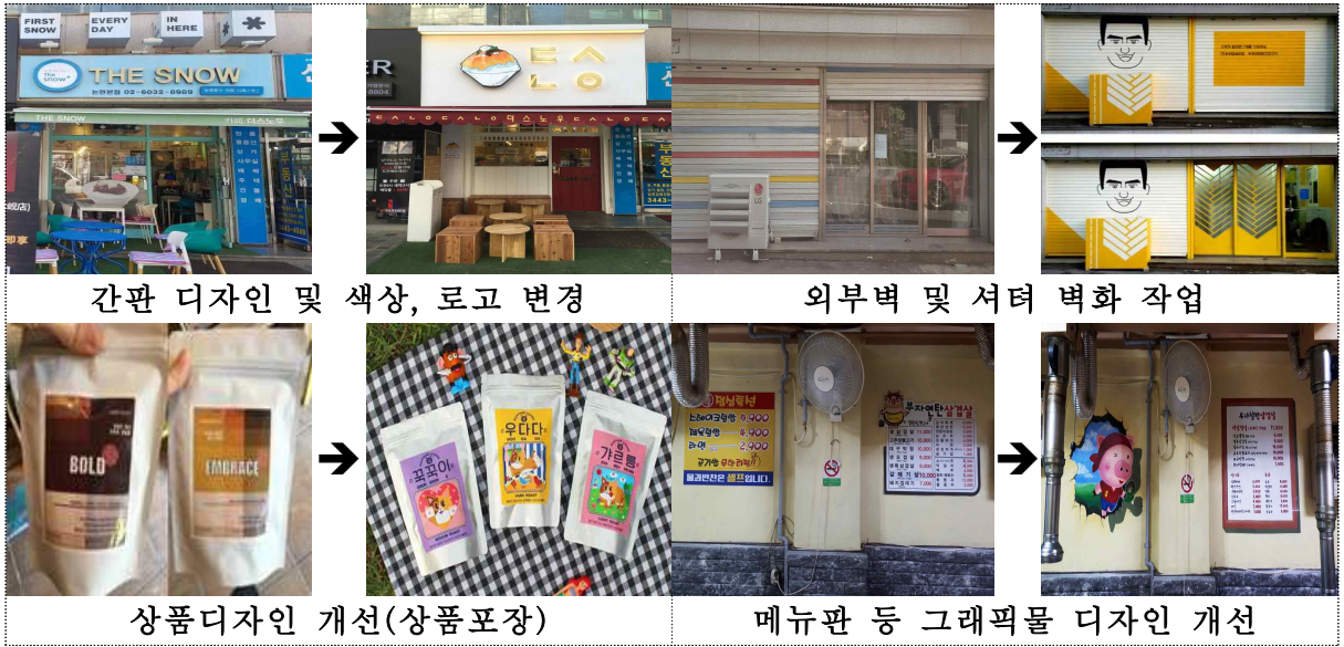
간판 디자인 및 색상, 로고 변경